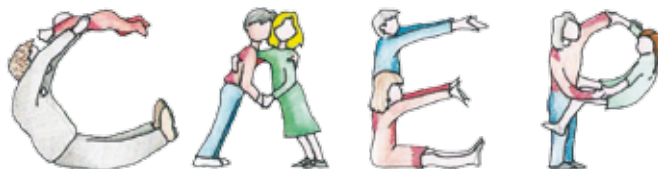
Coordinamento Attività Educative Pavoniane

Il Centro Educativo di Monza è parte costitutiva del coordinamento, attivo da alcuni anni, delle attività educative delle altre case pavoniane presenti sul territorio nazionale.